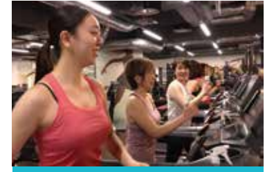
有酸素マシンのご案内 脂肪燃焼に効果的な有酸素マシン。あなたに最適な使用方法をご案内します。