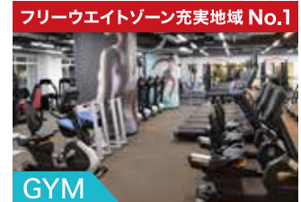
GYM 高機能マシンで効率よく鍛える!