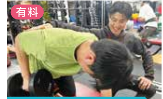
パーソナルトレーニング

本気のダイエットを応援。 「ダイエット」をはじめ「姿勢改善」や「腰痛や肩こりの予防」など、目的に応じた効果的なメソッドで理想のボディメイクを実現します。