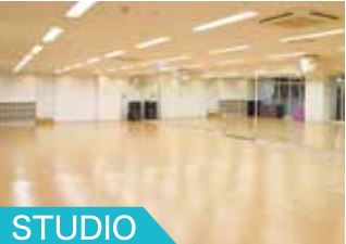
STUDIO 多彩なプログラムを快適に!