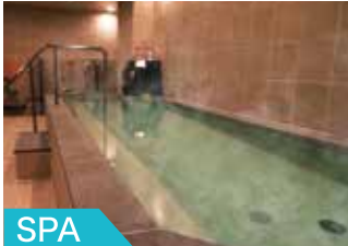
SPA お風呂やサウナでリフレッシュ!