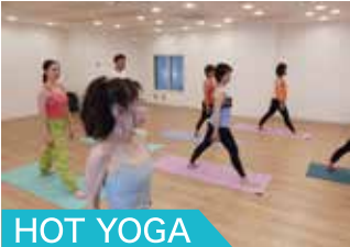
HOT YOGA 人気のホットヨガが受け放題!