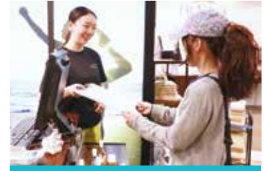
インボディ測定&カウンセリング 体組成データをもとに、個々に最適な運動プログラムを作成します。

クラブの利用方法や運動の基礎がよくわかるオリエンテーションを実施して、入会者のスタートを応援します。