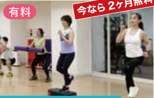
フィットネススクール

本気のダイエットを応援。 「ダイエット」をはじめ「姿勢改善」や「腰痛や肩こりの予防」など、目的に応じた効果的なメソッドで理想のボディメイクを実現します。