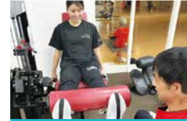
筋トレマシンのご案内 効率よく筋力アップできるマシンの効果的な使用方法をご案内します。